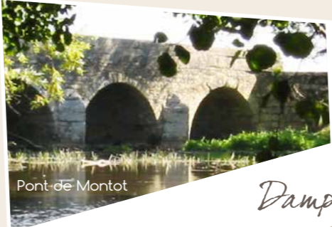
Pont de Montot