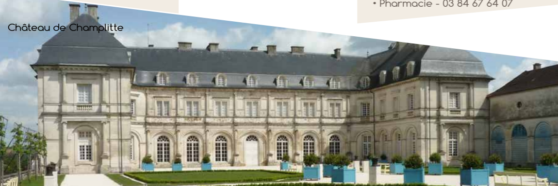
Château de Champlitte

Contact Office de Tourisme Région de Champlitte 2, Allée du Sainfoin 70600 Champlitte 03 84 67 67 19 ot.champlitte@orange.fr