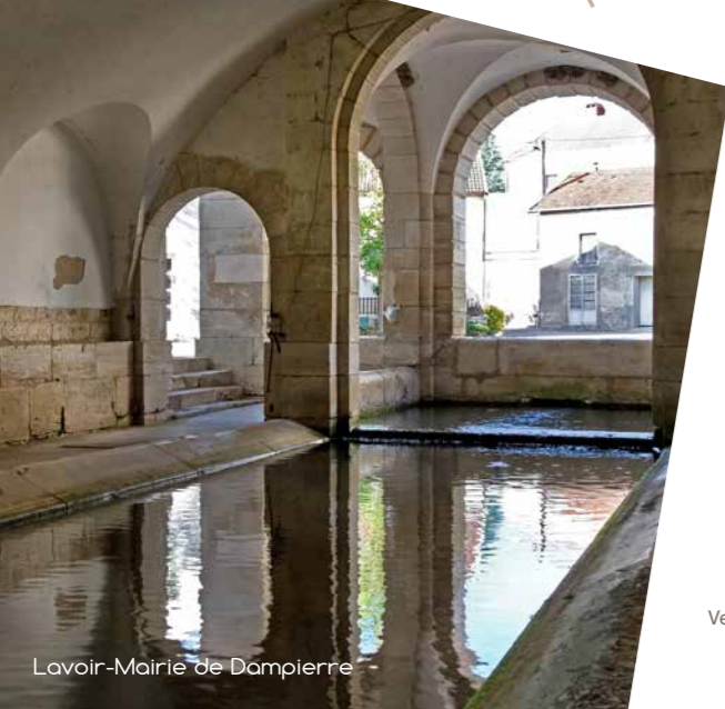
Lavoir-Mairie de Dampierre