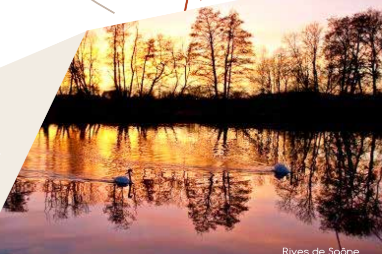
Rives de Saône