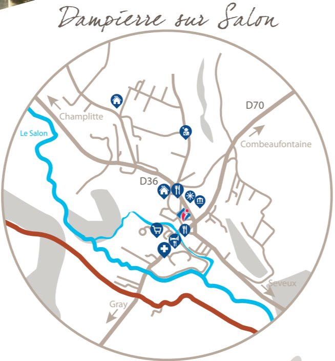
Dampierre sur Salon