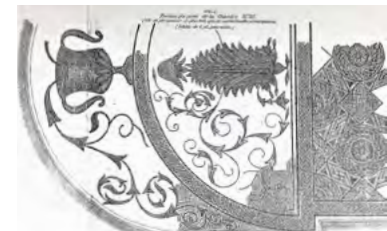
Dodécaèdre bouleté Mosaïques de la « chambre 25 »