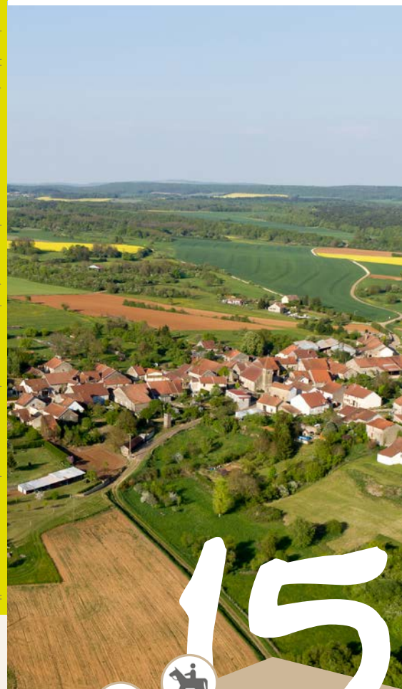
Office de tourisme de Champlitte 2016