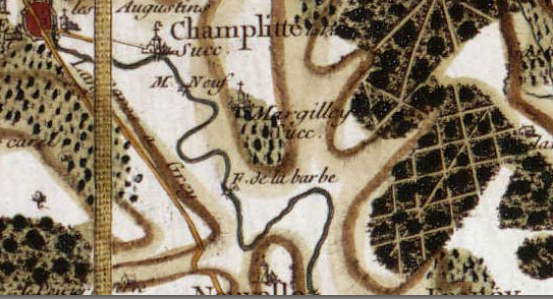
Carte de Cassini

Lieu dit "Le Moulin de la Barbe" : de 1670 à 1812, une usine métallurgique se composant d'une forge et d'un haut-fourneau est installée au bord du Salon. En 1772, l'établissement produit 250 tonnes de fonte et 100 tonnes de fer par an. En 1788, seul le haut-fourneau fonctionne encore.