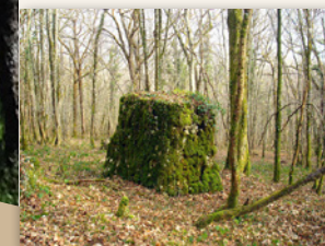
L'Auge des Druides

De nombreux ateliers de poterie s'étaient alors installés dans la cité, réputée pour son argile abondante. Le nombre considérable de poteries trouvées dans la terre, et le sous-sol argileux en beaucoup de points du territoire expliquent l'étymologie latine du nom Argillières, qui est le mot "argillarius" = terres d'où l'on extrait l'argile pour faire des pots.