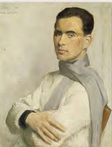
Autoportrait du peintre